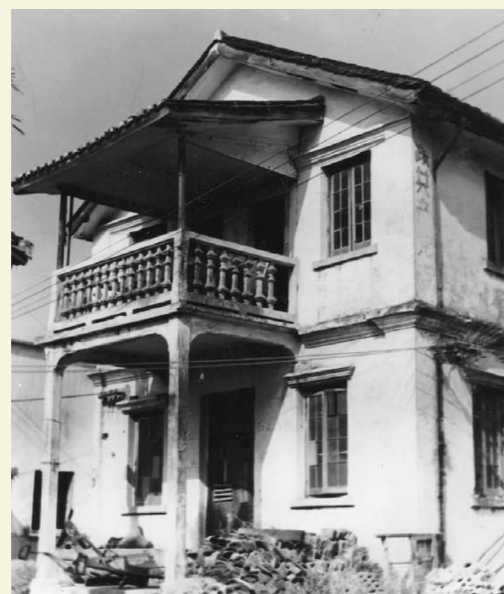
新四军六师师部旧址