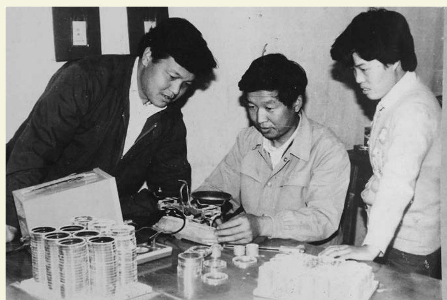
八士斗中五金电器厂工作场景