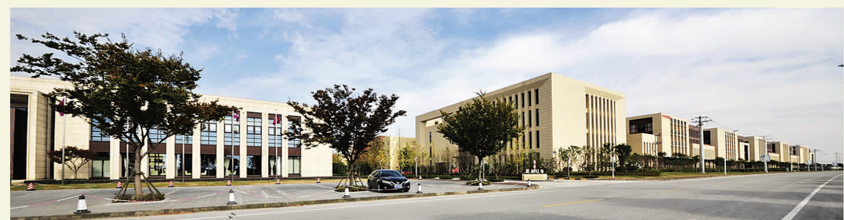
联东U谷·无锡国际企业镇