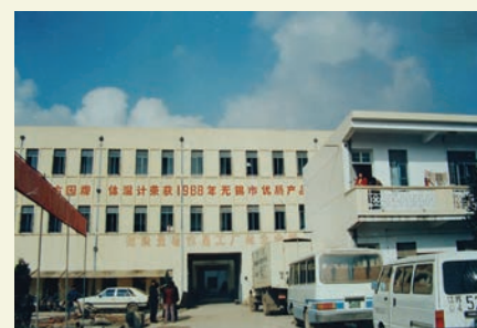
无锡县医用仪表厂