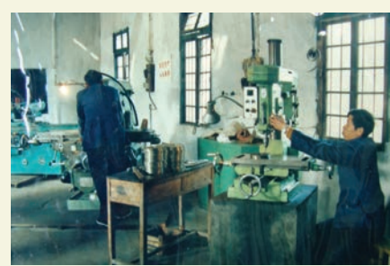
无锡县第四通用机械厂