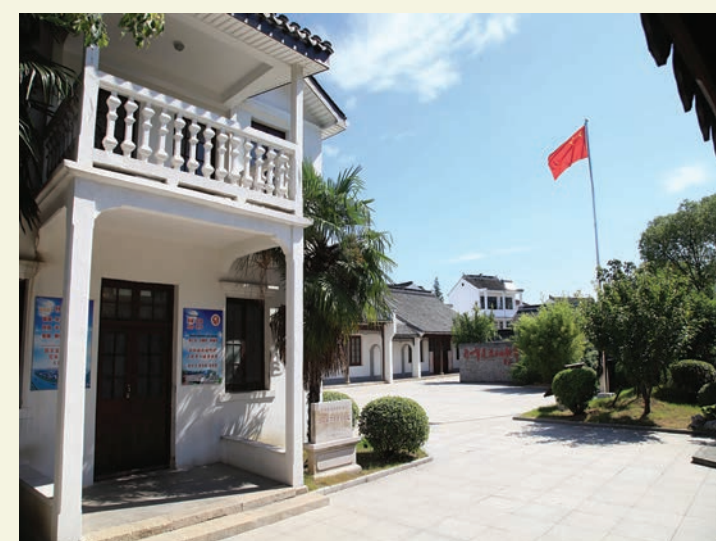
新四军六师师部纪念馆