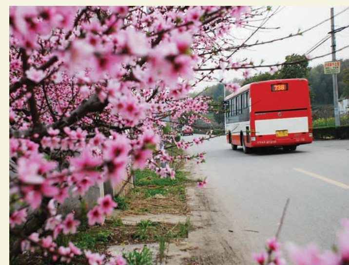
开通的第一个公交车